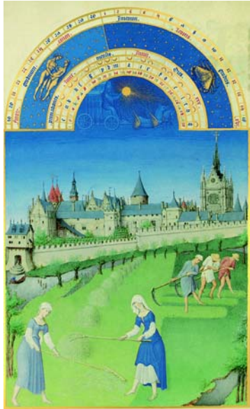
Stundenbuch ‚Les Très Riches Heures‘ von Herzog von Berry, gemalt von den Brüdern von Limburg und Jean Colombe, Paris, 1418 - 1485. Ausschnitt: Kalenderblatt zum Monat Juni. Bauern bei der Heuernte. Im Hintergrund die Pariser Residenz des Herzogs von Berry, Hôtel de Nesle.